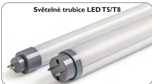
Světelné trubice LED T5/T8